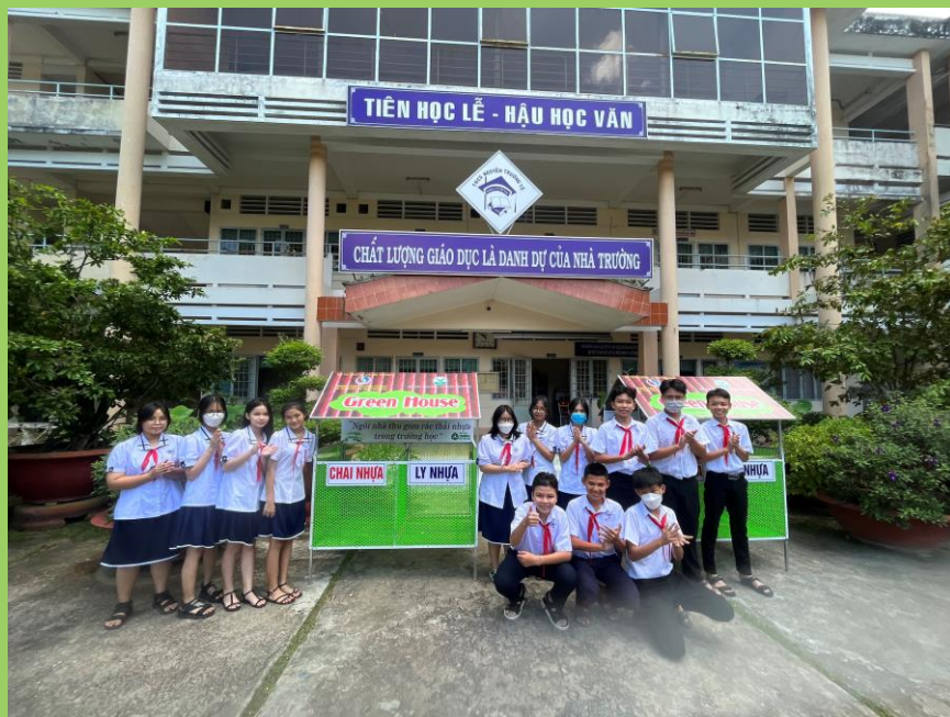
Mô hình thu gom rác thải nhựa tại trường học tại tỉnh Vĩnh Long