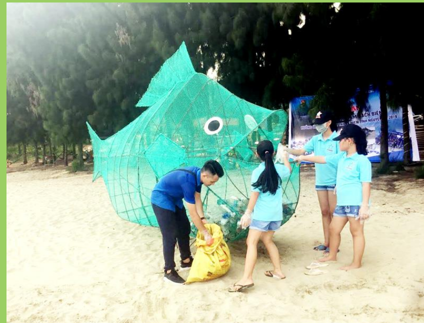
Mô hình thu gom rác thải nhựa trên bãi biển tại xã Cái Chiên, Hải Hà, Quảng Ninh